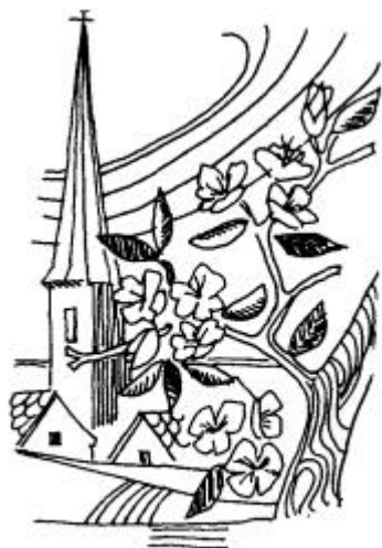
Tableau des Cultes dans les trois Temples